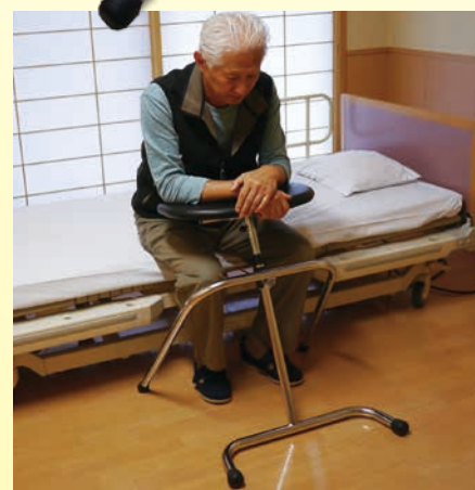
ベッドサイドでの端座位保持