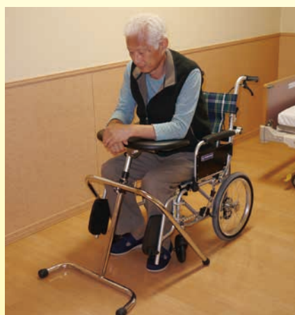
車いす・介護いすでの姿勢保持