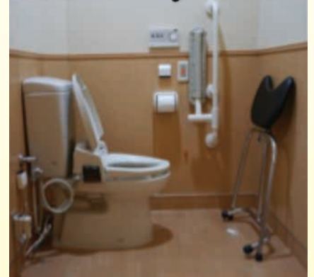
折りたたんで場所をとりません