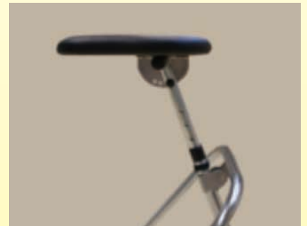
高さや角度が調整できます