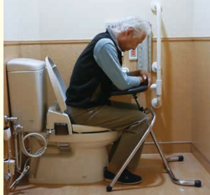
狭いトイレでも使えます